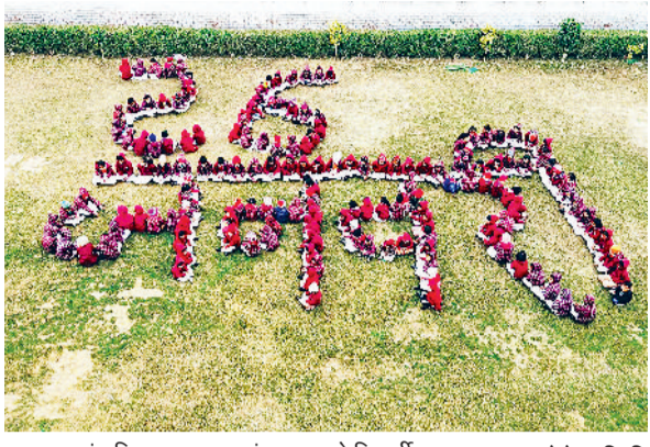
भूना। गणतंत्र दिवस पर मानव श्रृंखला बनाते विद्यार्थी।