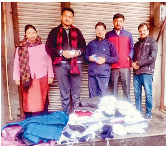
सिरसा। जरूरतमंदों को गर्म वस्त्र वितरित करते संस्था के सदस्य।