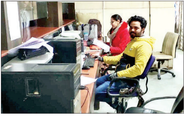
फतेहाबाद। तहसील कार्यालय में रजिस्ट्रियां करते कर्मचारी।

जिले के पटवारियों और कानूनगो की हड़ताल के चलते जहां एक तरफ आम जनता त्रस्त है। लोगों के तहसील कार्यालय से जुड़े काम नहीं हो रहे वहीं दूसरी तरफ तहसील कार्यालय में एक पटवारी ऐसा भी है जो हड़ताल से हटकर कार्यालय में अपनी सेवाएं जारी रखे हुए है। यही वजह है कि तहसील कार्यालय में 50 फीसदी रजिस्ट्रियां हो रही हैं, जिसके चलते सरकार को 50 फीसदी राजस्व सरकार को अभी भी मिल रहा है। जिला में पटवारी एवं कानूनगो एसोसिएशन अपनी मांगों को लेकर 3 जनवरी से लगातार काम का बहिष्कार कर हड़ताल पर है। जिले में पटवारियों के 161 पद स्वीकृत है। वर्तमान में जिले में 98 पद खाली हैं और 63 पटवारी मौके पर कार्यरत है। यह पटवारी सचिवालय के बाहर धरने पर बैठे हैं। वीरवार को धरने में 42 पटवारियों ने भाग लिया। हड़ताल से पूर्व फतेहाबाद तहसील कार्यालय में प्रतिदिन 50 के करीब जमीन-जायदाद की रजिस्ट्रियां होती थी, जिससे सरकार को स्टाम्प ड्यूटी व रजिस्ट्री फीस के रूप में करीब 70 लाख रुपये प्रतिदिन प्राप्त होता था। पिछले 23 दिनों से जिले की टोहाना,