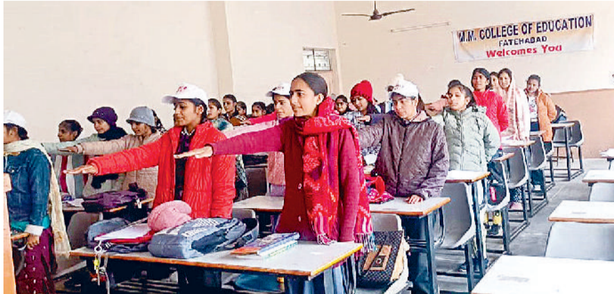
फतेहाबाद। एमएम शिक्षण महाविद्यालय में राष्ट्रीय मतदाता दिवस पर शपथ लेते विद्यार्थी।

भारत में राष्ट्रीय मतदाता दिवस हर साल 25 जनवरी को मनाया जाता है। यह दिवस भारत के प्रत्येक नागरिक के लिए अहम है। इस दिन भारत के प्रत्येक नागरिक को अपने राष्ट्र के प्रत्येक चुनाव में भागीदारी की शपथ लेनी चाहिए, क्योंकि भारत के प्रत्येक व्यक्ति का वोट ही देश के भावी भविष्य की नींव रखता है, इसलिए हर एक व्यक्ति का वोट राष्ट्र के निर्माण में भागीदार बनना है। इसी उद्देश्य से आज एमएम शिक्षण महाविद्यालय में एनएसएस विभाग की ओर से मतदाता शपथ कार्यक्रम का आयोजन किया गया।