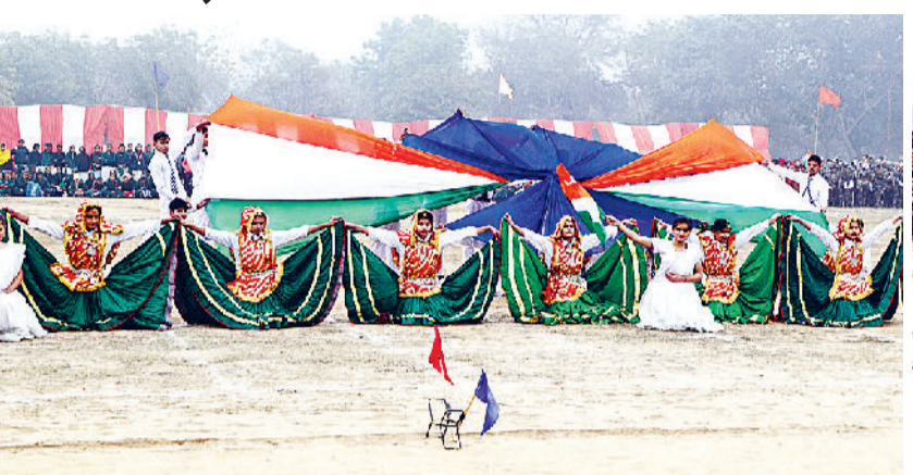
फतेहाबाद। पुलिस लाइन में आयोजित फुल ड्रेस फाइनल रिहर्सल में सांस्कृतिक कार्यक्रमों की प्रस्तुति देते स्कूली बच्चे।